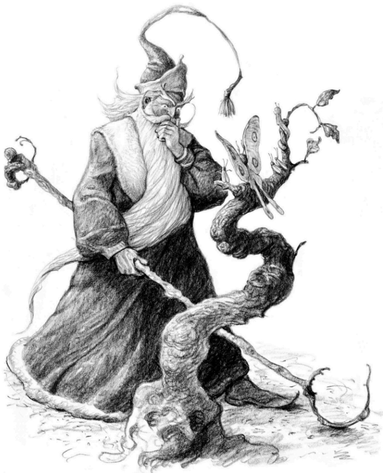
Ombric stă pe gânduri